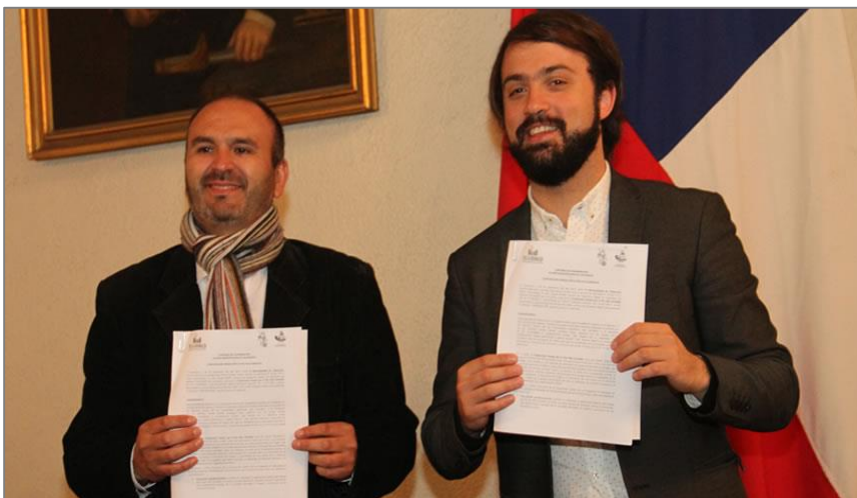
*Firma de convenio con municipalidad de Valparaíso

Durante el segundo semestre de 2017, el Área implementó el proyecto “Estudiantes de Valparaíso como Embajadoras y Embajadores de la Memoria” , financiado con el apoyo del Estado Alemán de Hesse, implementado a través de World University Service y con la colaboración de la Municipalidad de Valparaíso. Se trabajó con 100 estudiantes pertenecientes a 10 liceos municipales de la Comuna de Valparaíso.