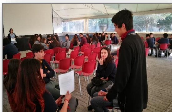
*Fotografías de los primeros talleres implementados, septiembre y octubre 2017